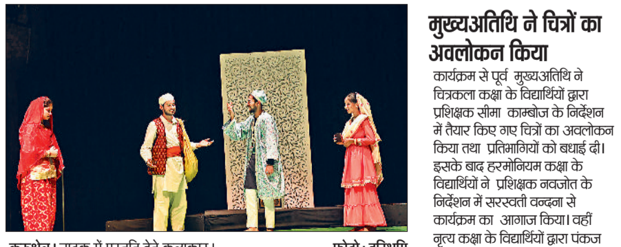
कुरुक्षेत्र। नाटक में प्रस्तुति देते कलाकार।