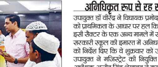
पानीपत। समाधान शिविर में जनसुनवाई करते हुए प्रशासनिक व पुलिस अधिकारी, आदि।