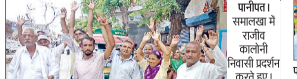
पानीपत। समालखा में राजीव कालोनी निवासी प्रदर्शन करते हुए।