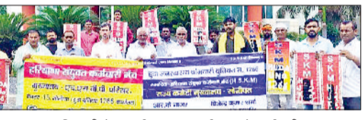
पानीपत। हुडा संपदा अधिकारी के कार्यालय पर प्रदर्शन करते कर्मचारी।

संपदा कार्यालय पानीपत के तहत टेकेदारी पर वर्षों से लगातार सेवा करने वाले 45 सफाई कर्मचारियों को टेंडर समाप्त होने के नाम पर हटाया था