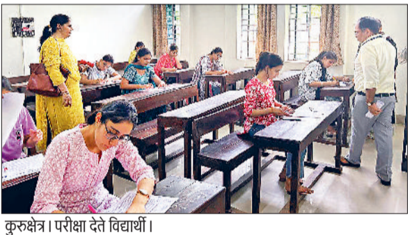
कुरुक्षेत्र। परीक्षा देते विद्यार्थी।