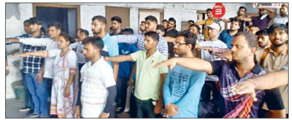
पानीपत। रक्तदान करने व नशा नहीं करने की शपथ लेते हुए युवा शक्ति।